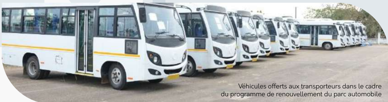
Véhicules offerts aux transporteurs dans le cadre du programme de renouvellement du parc automobile

L'Etat ivoirien n'attend également pas s'arrêter en si bon chemin. Il attend importer pour la phase 2 du programme 1000 véhicules qui seront remis à l'ensemble des entreprises de transport sur l'étendue du territoire. Au vue de toutes les réformes susmentionnées, sommes-nous tentés de nous interroger sur les retombées de ces politiques ?